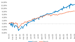
GRÁFICO DE DESEMPENHO

O fundo MAG Global Credit BRL FIF Multimercado aplica no fundo offshore AEGON HIGH YIELD GLOBAL BOND FUND, que possui estratégia de selecionar ativos de crédito que entreguem altas taxas de retorno na renda fixa, baixa correção com os principais ativos de renda fixa global e aliado a uma volatilidade menor que o mercado de ações no longo prazo.